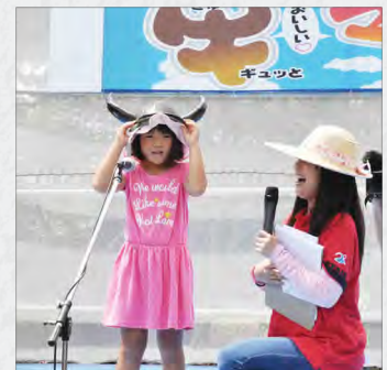
牛の鳴き声コンテスト