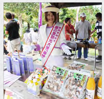
藤枝市からも出店