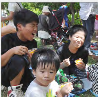
こんな顔になっちゃいます