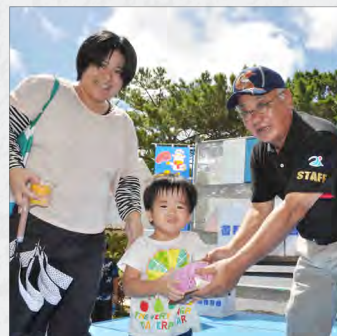
先着50名 マンゴーゲット