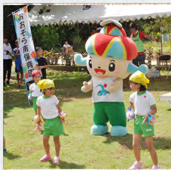
園児がキュートに盛り上げます