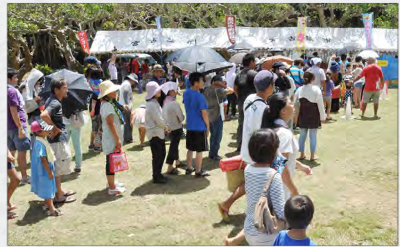
約 6,200 食の無料試食で大盛況！！