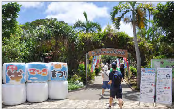
今年は牛 & マンゴー同時開催 in 植物園